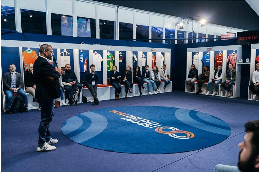
- Le vestiaire Sport Unlimitech -