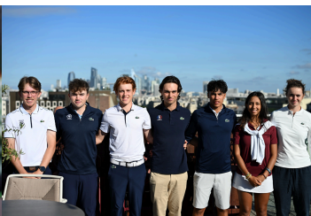
Membres de l'Équipe de France GOLF