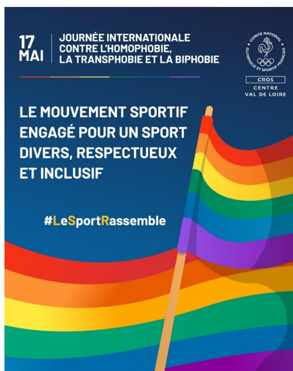
Figure 2- Visuel de la Journée contre l'homophobie

À l'occasion de cette Journée internationale de lutte contre l'homophobie, la transphobie et la biphobie , nous réaffirmons notre volonté de promouvoir un sport ouvert à toutes et à tous, sans distinction .