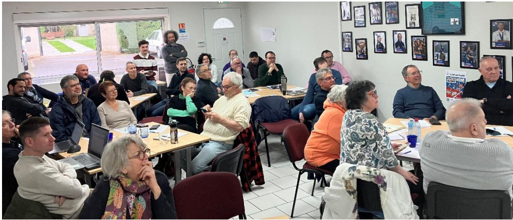
Figure 3- La formation des référents « éthique » au CROS – 13.03.2026