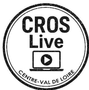
Figure 1- Affiche Enquête 2025

Le 13 février 2026 , le CROS Centre-Val de Loire a proposé un webinar "CROS Live" sur Violences dans le sport : comprendre leur banalisation pour mieux prévenir et agir.