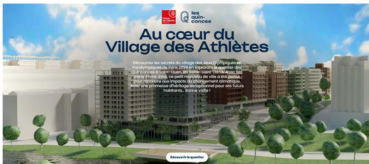
Page d'accueil de la visite immersive

Cette création inédite propose au public une visite unique et innovante d'une partie du Village des athlètes situé à Saint-Ouen-sur-Seine. L'agence Bright, spécialiste des contenus 3D, immersifs et ludiques, a été sélectionnée pour co-construire, aux côtés de la direction de la communication de la Caisse des Dépôts, cette visite immersive.