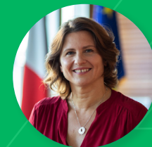
ROXANA MARACINEANU, Ministre des sports

Si l'État investit dans Paris 2024, c'est parce qu'au-delà des médailles et de la célébration, les Jeux sont un accélérateur unique pour le développement du sport en France. En termes de pratiquants, d'équipements mais aussi de transformation vertueuse et durable de nos organisations comme de nos modes de vie. À nous d'en faire aussi un levier de croissance pour nos entreprises et un tremplin pour notre jeunesse. Nos Jeux vont mobiliser 150 000 emplois et créer des opportunités dans de nombreuses filières. Nous devons tout faire pour que ces métiers trouvent preneurs. C'est aussi à cela que l'État veillera.