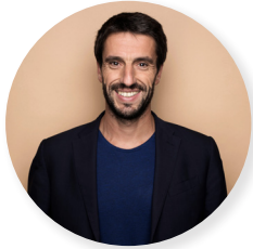
TONY ESTANGUET, Président des Jeux de Paris 2024

Il est indispensable que les Jeux de Paris 2024 profitent à toutes et à tous sur l'ensemble du territoire. C'est à cet effet que nous avons mis en place une charte emploi et développement territorial qui réserve 25 % des marchés aux TPE, PME et structures de l'ESS et 10 % des heures à des publics éloignés de l'emploi. Nous sommes fiers de cette dynamique collective qui s'est engagée avec nos partenaires !